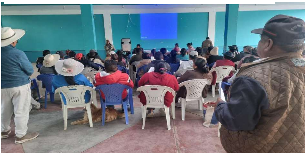
Comuneros relleno las encuestas en el local de la Comunidad Campesina de Sapallanga. 11/12/2022