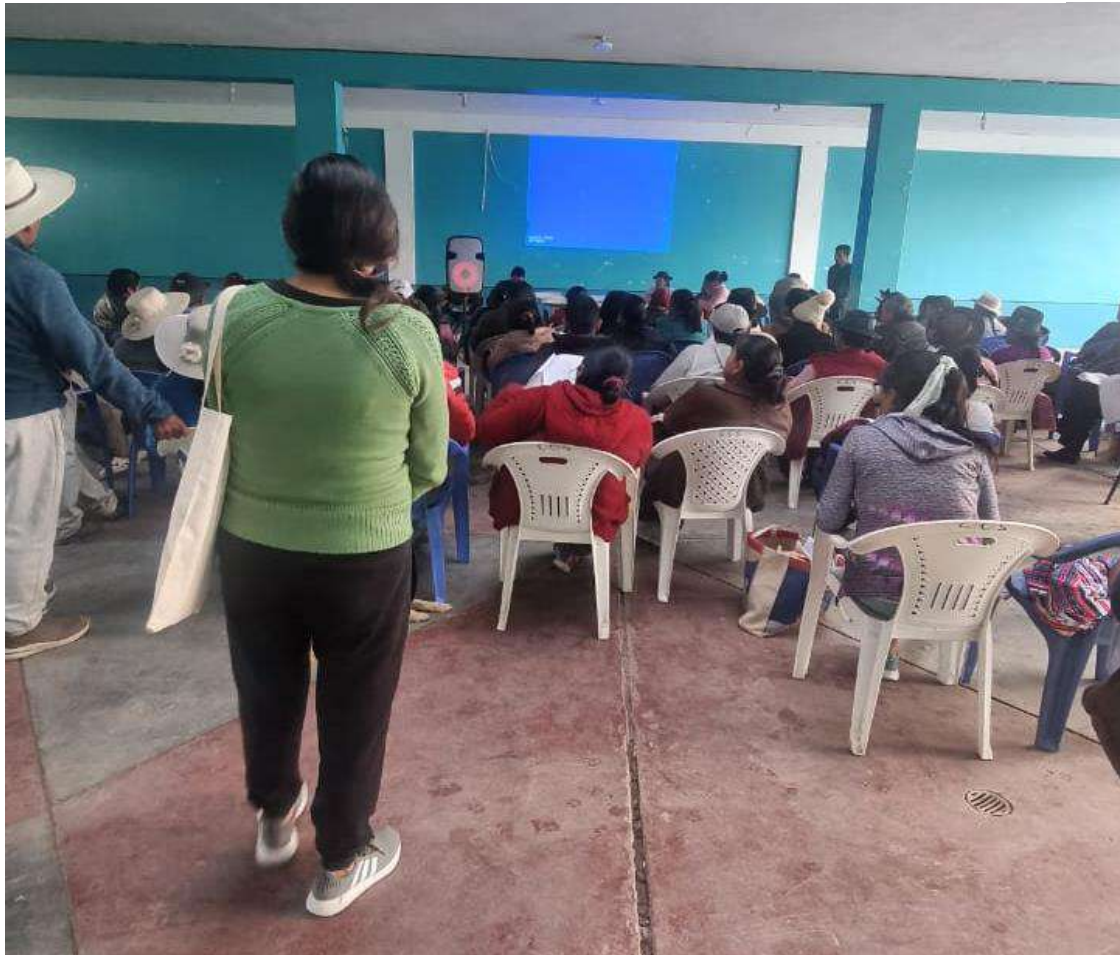
Esperando dar orientación a los comuneros que tengan inconvenientes con el llenado de las encuestas. 11/12/2022