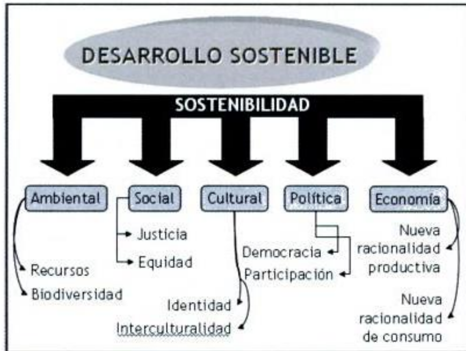
Figura 02: Desarrollo sostenible esperado