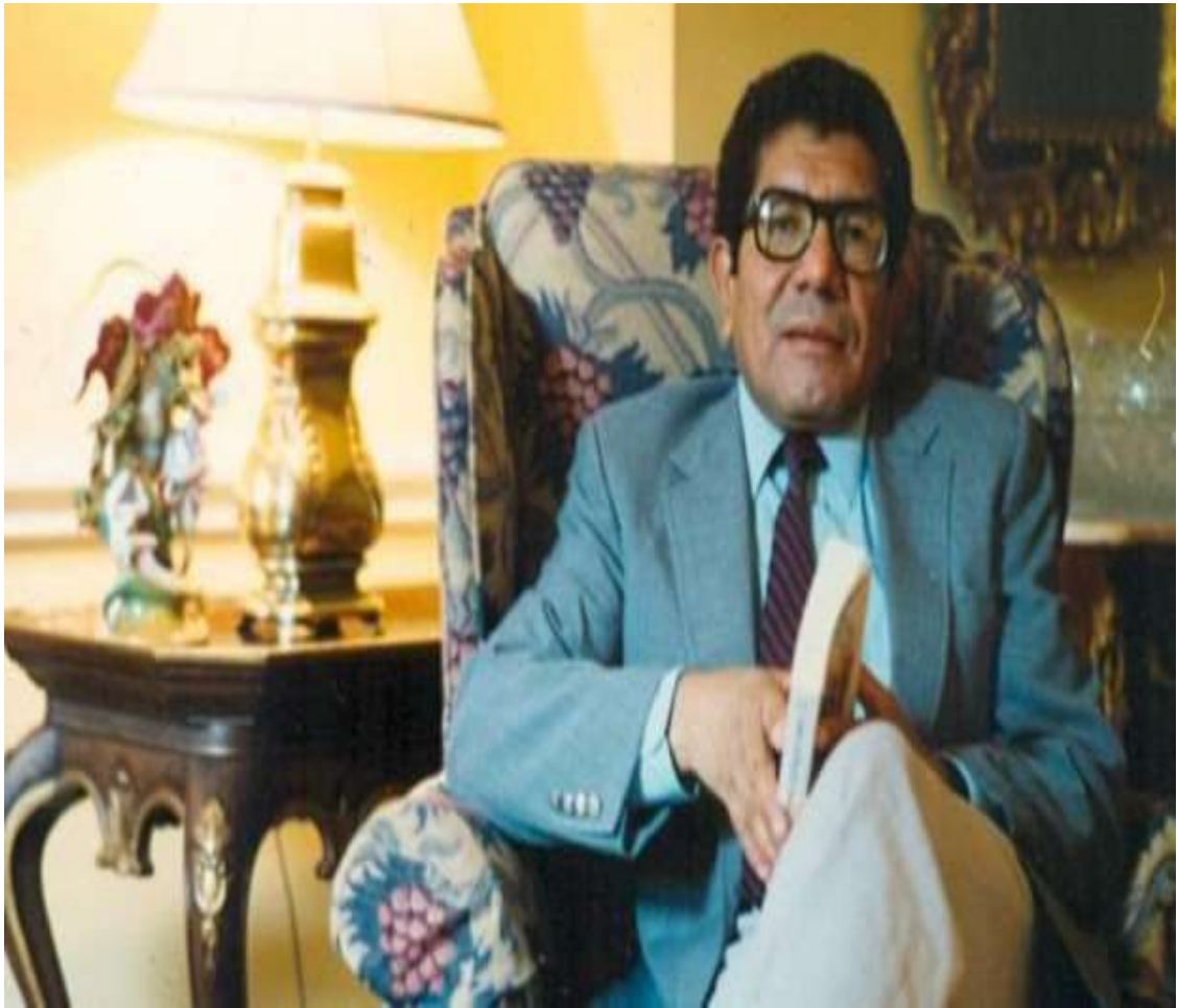
EL ESCRITOR Y MAESTRO GREGORIO MARTÍNEZ NAVARRO