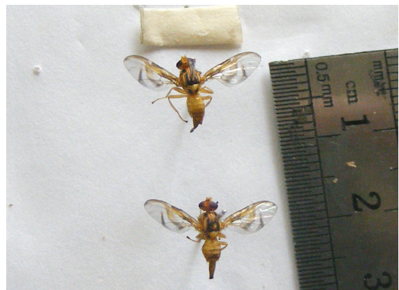
Figura 5. Mosca en guayaba ( A. striata )