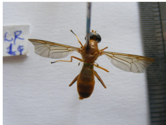
Figura 6. Mosca en caimito ( Ptectictus sp.) registrado por primera vez.