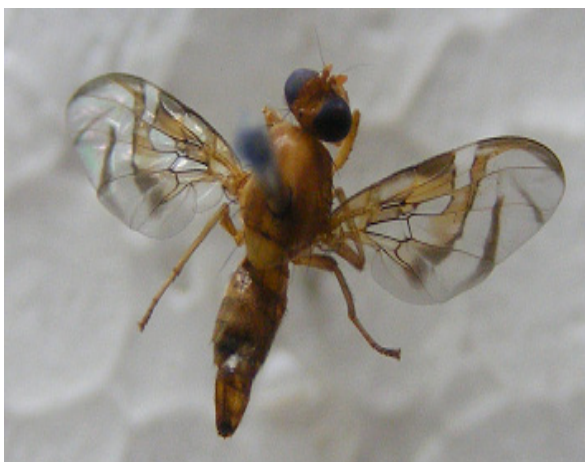
Figura 3. Mosca en río de oro ( A. fraterculus )