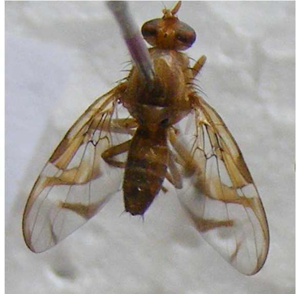
Figura 4. Mosca en mandarina cleopatra ( A. distincta )