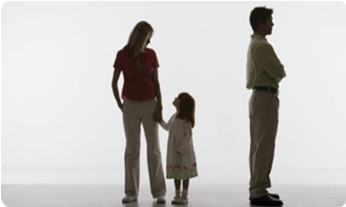
Foto 1. El omisor de espaldas a la madre y la hija

Fuente: Periódico mural del juzgado de familia