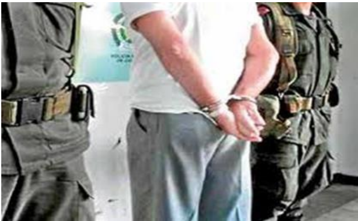
Foto 2. Omisorrequisitoriado capturado

Fuente: Periódico mural del juzgado de familia