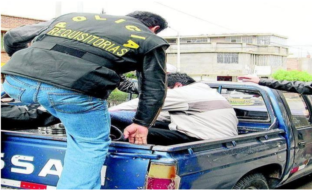
Foto 3. Omisor capturado y conducido