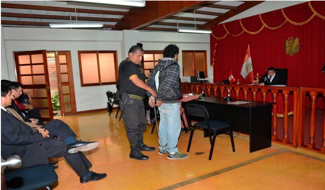
Fuente: Juzgado penal