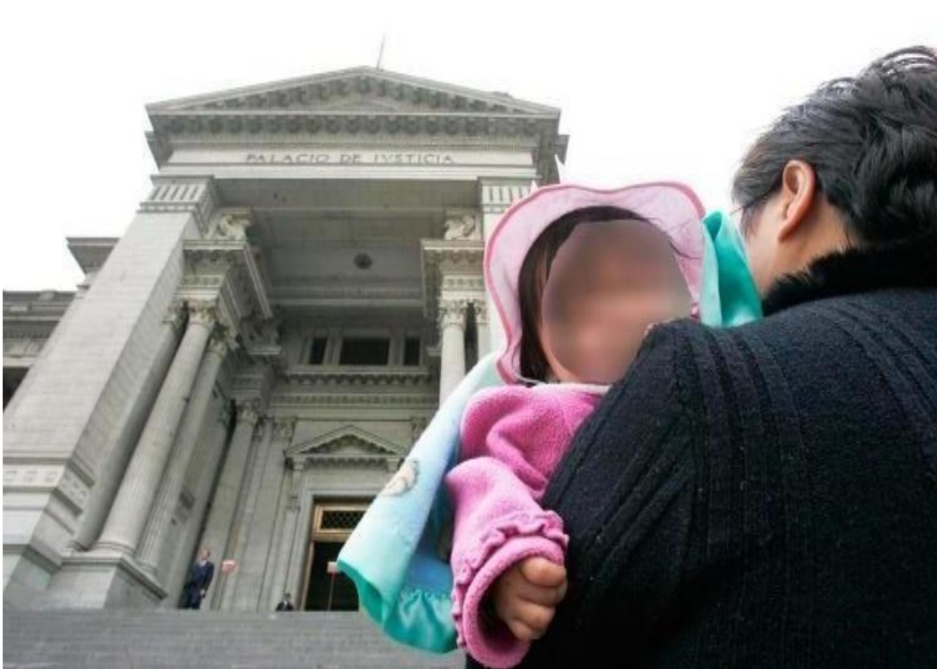
Foto 4. Palacio de justicia