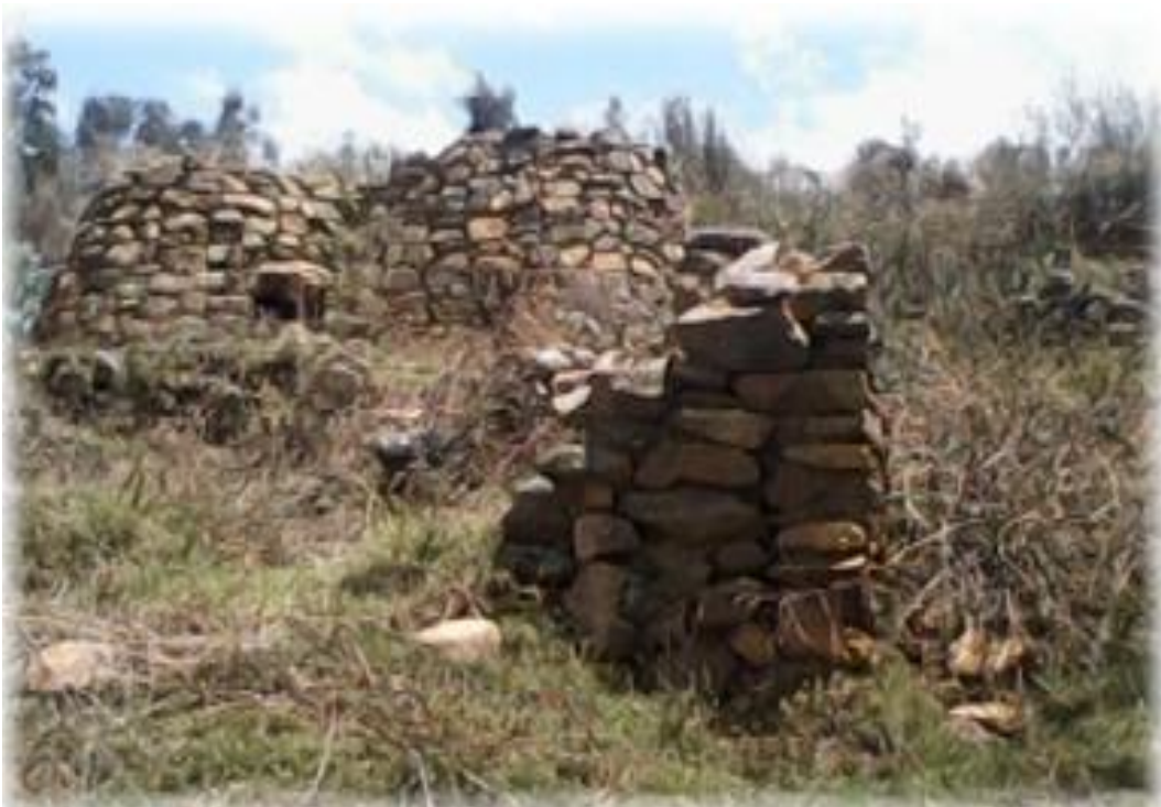
FIGURA 6: ESTADO ACTUAL DEL SITIO ARQUEOLÓGICO DE CHUCTULOMA