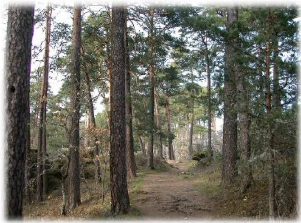
FIGURA 3: EXPLOTACIÓN FORESTAL