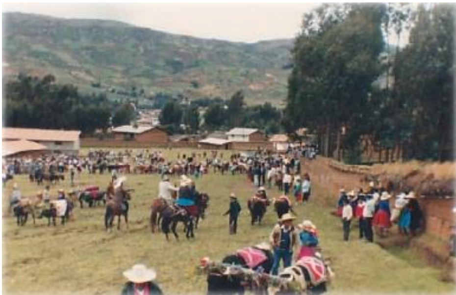
FIGURA 30 : FIESTA DE SAN LUCAS

Se celebra cada 18 de octubre, en la actualidad se ha dejado al abandono. Antes se realizaba concursos de yuntas en todo el pueblo.