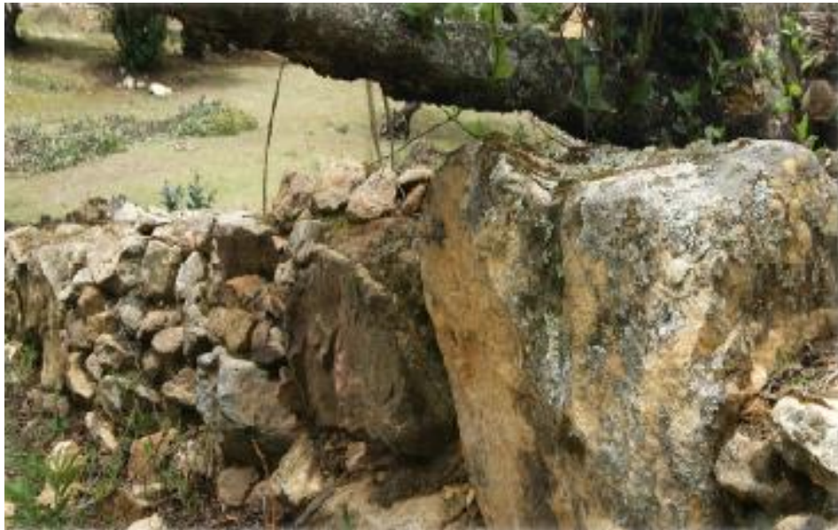
FIGURA 13: SITUACIÓN ACTUAL DE LOS CORRALONES DE TUNDUCHA

argamasa que unía la tierra arcillosa con arena, estiércol y cabellos de humanos (como lo afirman los pobladores entrevistados). Se desarrolló en el periodo intermedio Tardío aproximadamente entre los años de 1 000 a 1 460 años.