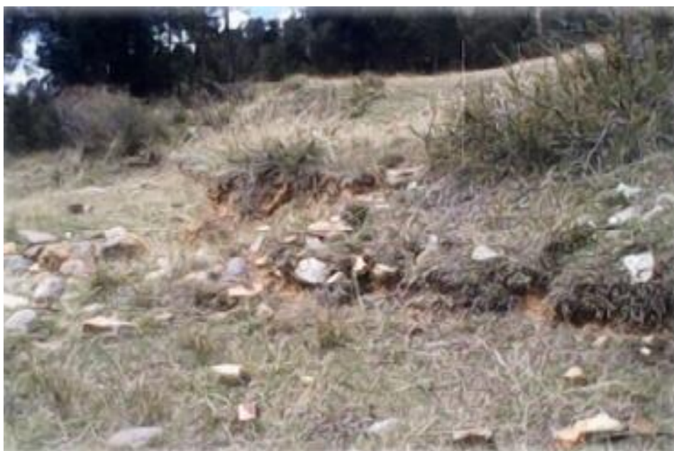
FIGURA 11: RESTOS ARQUEOLÓGICOS DE CHUWI

Hasta algunos años se podía notar a más construcciones y características de esos tiempos, pero por el descuido de las autoridades y población, actualmente ya no encontramos nada quedando en el anonimato la existencia de este rico sitio arqueológico para las generaciones posteriores. El sitio arqueológico de Chuwi, es uno de los muchos que no es reconocido por la población Quilqueña, son muy pocos las que la conocen, no se sabe la fecha exacta en la que se creó Chuwi, pero se dice según diversas investigaciones que se desarrolló en el periodo intermedio tardío. Este sitio arqueológico en la actualidad va desapareciendo, solo quedan algunos restos, el principal problema de su desaparición es que las personas utilizan este espacio para la siembra y el pastoreo de sus animales.