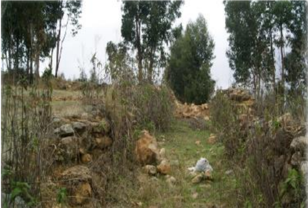
FIGURA 15: SITIO ARQUEOLÓGICO LOS CAMINOS QUILQUEÑOS PRE INCA