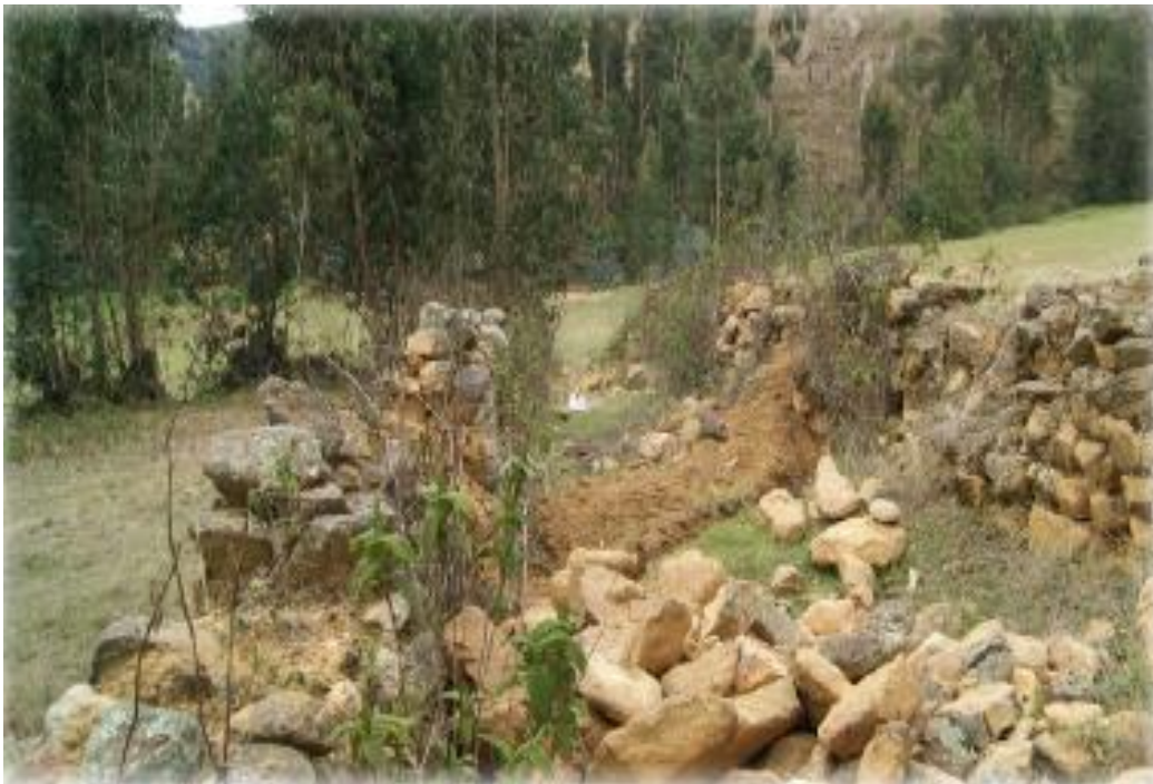
FIGURA 16: DEGRADACIÓN DEL SITIO ARQUEOLÓGICO LOS CAMINOS QUILQUEÑOS PRE INCA