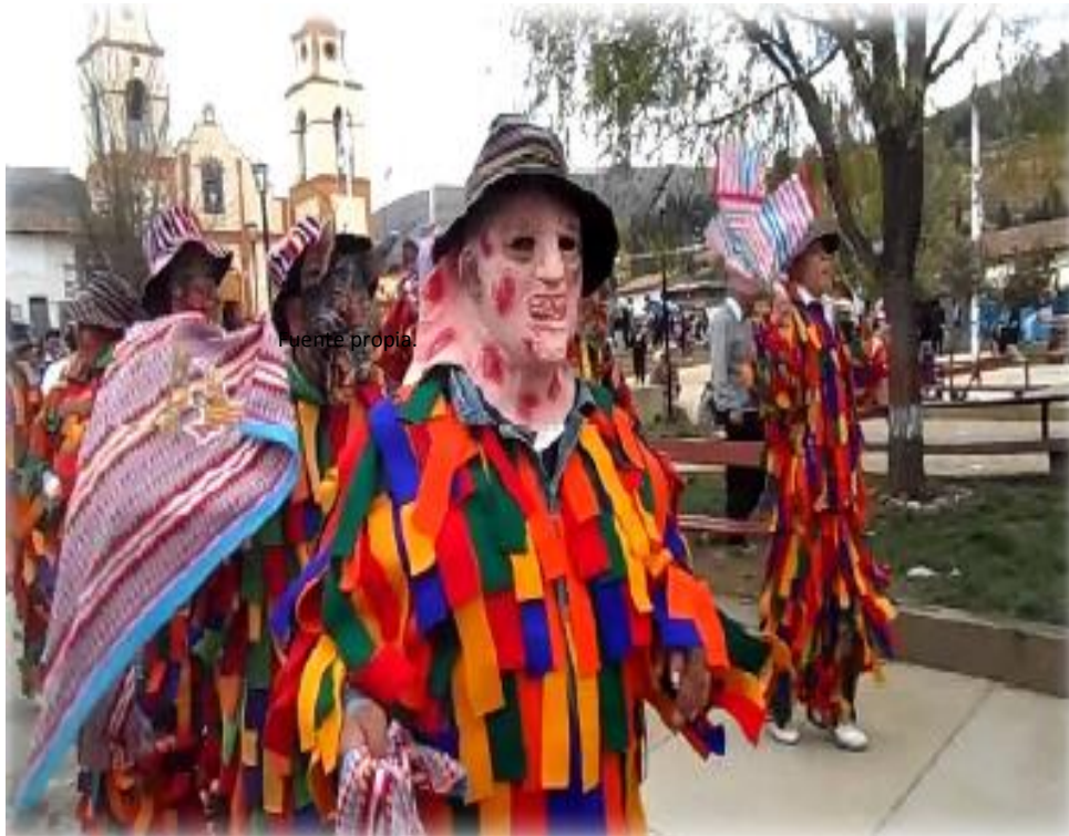
FIGURA 4: LOS AVELINOS

El Distrito de Quilcas, cuenta con variados recursos naturales, y zonas arqueológicas de atractivo turístico, aún no es aprovechado en todo su potencial turístico por la falta de acondicionamiento, promoción y difusión oportuna. Según información del INEI, el Distrito de Quilcas posee 04 atractivos turísticos, de los cuales, 3 son zonas arqueológicas y 1 es paisajístico o lugar pintoresco. Existen otros atractivos turísticos aún no explorados en su real dimensión.