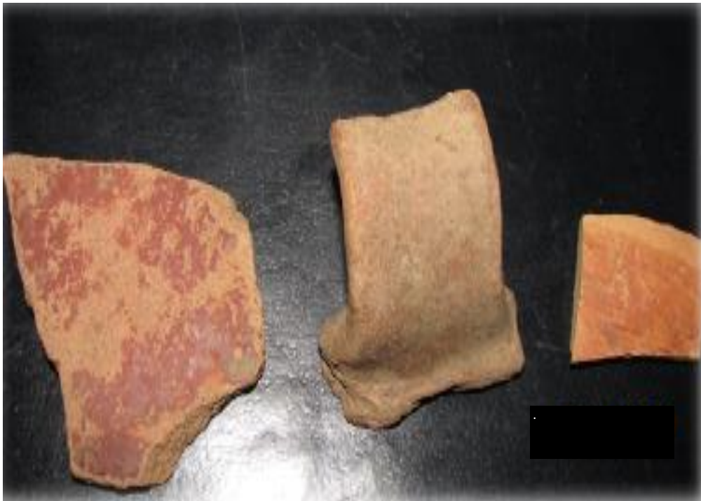
FIGURA 8: PESTOS DE CERÁMICA DE CHUCTULOMA