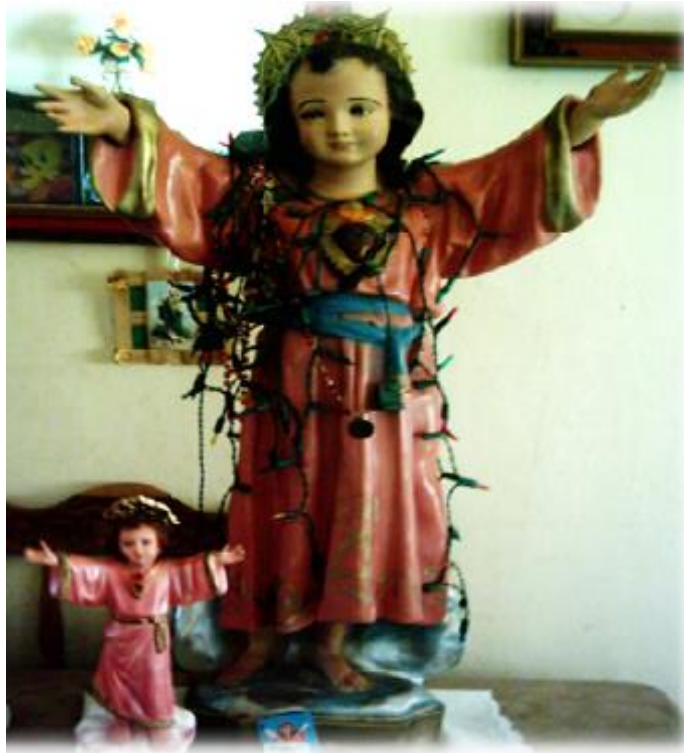
FIGURA 18: IMAGEN DEL DIVINO NIÑO JESÚS