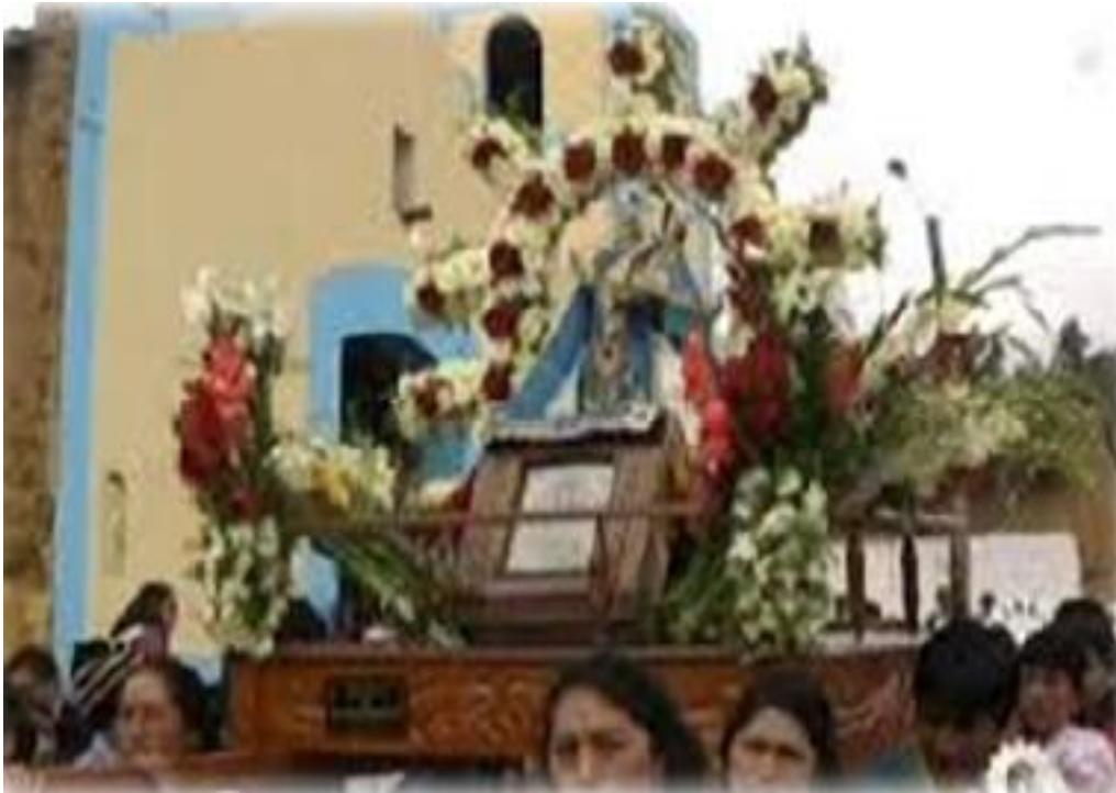
FIGURA 29 : PROCESIÓN DE LA VIRGEN DE COCHARCAS