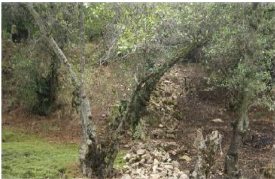
FIGURA 14: BOSQUE DE TUNDUCHA