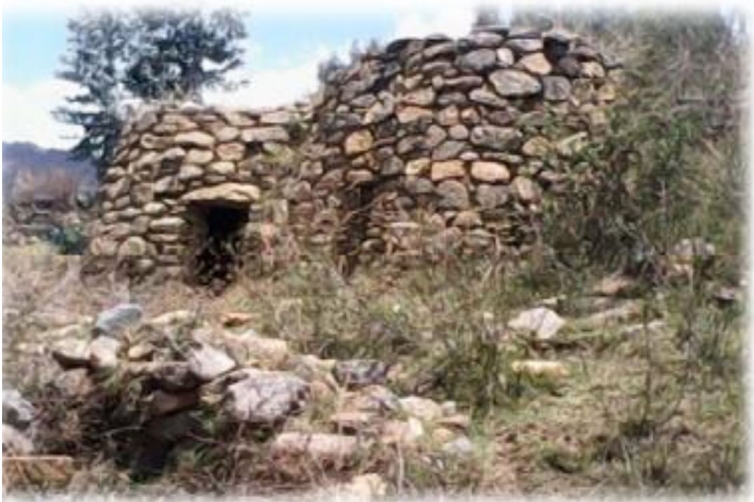
FIGURA 5: SITIO ARQUEOLÓGICO CHUCTULOMA