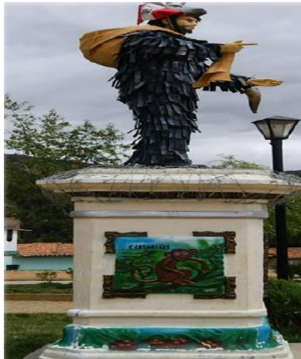
FIGURA 19: VISTA LATERAL DEL AVELINO CUSHIRI

El Avelino se encuentra en el lado Suroeste de la plaza principal de Quilcas, fue creada junto con el parque el 13 de febrero de 1937. El Avelino representa la guerra del pacífico a diferencia al de San Jerónimo el Avelino Cushiri se caracteriza por la máscara de venado llevada en la cabeza, carga en su espalda un quipi donde lleva sus alimentos y su vestuario juntamente lleva la bandera del Perú.