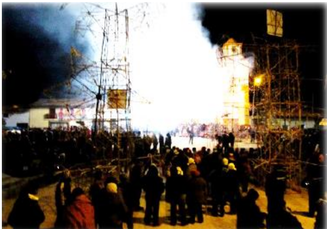
FIGURA 27 : VÍSPERA DE LA FIESTA DE SAN PEDRO