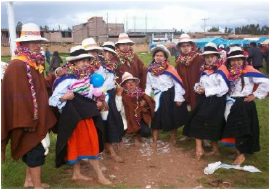
FIGURA 25: PANDILLA DE JÓVENES QUE BAILAN CARNAVALES

jóvenes y adultos alrededor de los árboles. Al segundo día propiamente es el corta monte, iniciándose con un desayuno en la casa del padrino.