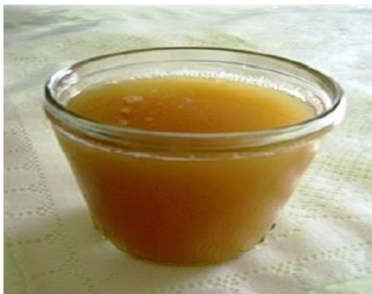
FIGURA 34 : CHICHA DE JORA

En primer lugar se alza el agua en un cilindro, mezclar los 3 tipos de jora y la quinua en un recipiente a parte; una vez mesclado echar al cilindro, echar también toda las hiervas mencionadas y las frutas tiene que hervir aproximadamente 1 hora. Una vez listo la chicha se cola para hacer enfriar. Sin embargo el ulpo ya debe estar enterrado en el suelo, una vez fría la chicha se le hecha en el ulpo, la boca del ulpo debe ser tapado con papel de azúcar y para que no le chapla alma se le coloca el junco, para que este bien maduro se deja aproximadamente 3 días. Luego sacar del ulpo un balde de chicha, hacer hervir la chicha con manzana y piña picada, canela clavo de olor aproximadamente 10 minutos luego echar en cada ulpo y azúcar al gusto. Los ingredientes que se utiliza para esta chicha son: Jora negra de maíz, Jora extranjera, Jora centimilla, Quinua, frutas (manzana, piña, naranja, caña de azúcar), hiervas (hierva luisa, cedrón, toronjil), chancaca, azúcar, canela y clavo de olor.