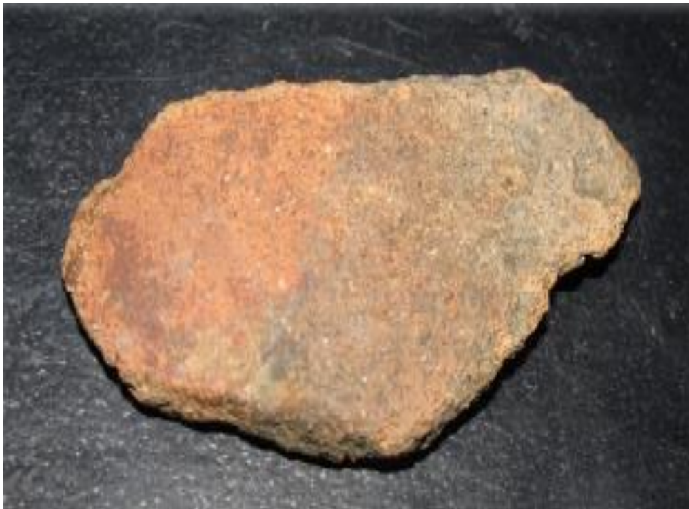
FIGURA 7: PARTE DE LA CERÁMICA DE CHUCTULOMA

La cerámica en el distrito de Quilcas está desapareciendo; a las personas que habitan en el pueblo se dedican a otra clase de trabajo la mayoría se dedican a la agricultura (Davila, 2004).