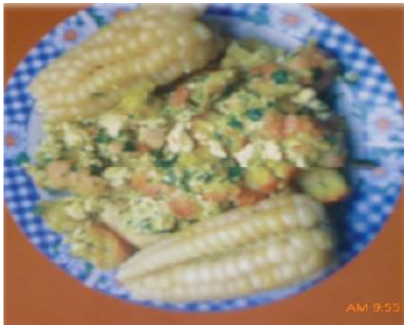
FIGURA 31: PRESENTACIÓN DEL PLATO SOPA DE PAN

Este plato típico se consume mayormente en el almuerzo de los días viernes durante la época de cuaresma (Ávila Mayta, Nilda – comerciante).