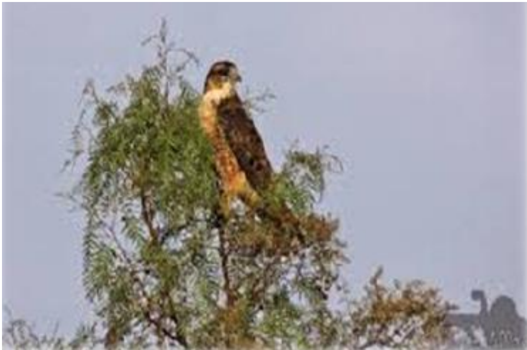
FIGURA 23: EL QUILINCHO

De estas y muchas creencias que permanecen en los pueblos andinos algunos son imprescindibles para el campesino porque como decíamos son indicadores naturales, sobre todo climatológico que sirven para prevenir tal o cual fenómeno geográfico y/o meteorológico, de ahí su importancia en la historia de las altas culturas como los incas y otros, quienes se guiaron de ellos, para sus campañas agrícolas y ganaderas.