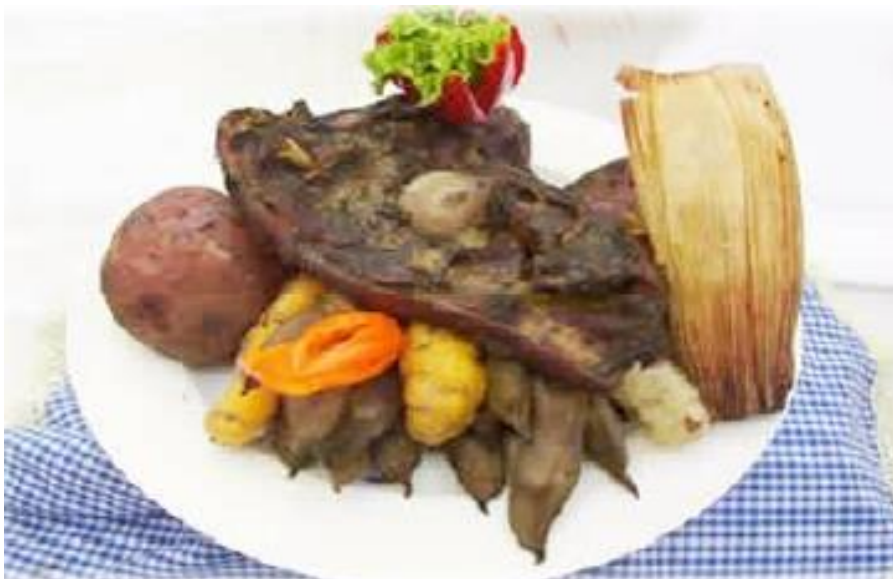
FIGURA 32: PLATO TÍPICO QUILQUEÑO DE PACHAMANCA

Lo primero que se debe hacer es preparar un horno, el cual está compuesto de un hoyo en el suelo y de piedra que le cubre a este hoyo, en donde se colocan las leñas y se prenden para hacer calentar las piedras aproximadamente 3 horas. Cuando las piedras están de color blanco o plomo claro se saca toda la ceniza de la leña y algunas piedras, y se coloca los ingredientes de esta manera o de este orden: las papas, las ocas, la carne sazonado, en seguida las humitas y las habas, las piedras que se han sacado se van colocando con los ingredientes y a todo este se le cubre con la planta llamada “malma”, después con plásticas y posteriormente se le cubre con un manto de tierra para que no escape el vapor. La comida debe estar enterrada por lo menos ½ hora para que este bien cocida. Los ingredientes de este plato son los siguientes: carne de res o carnero (sazonada con huacatay), papas, oca, humitas de maíz y habas. Y finalmente se degusta el delicioso plato acompañado con un mate de anís.