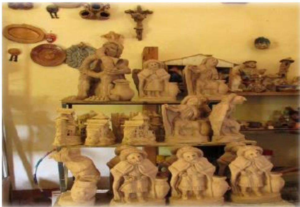
FIGURA 22: CERÁMICAS DECORATIVAS DE LA HUACONADA