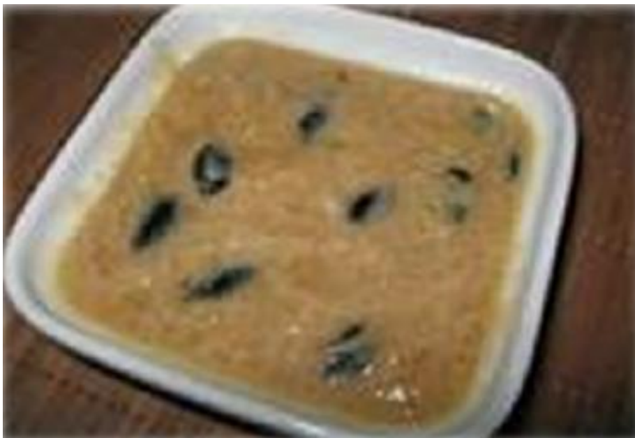
FIGURA 33 : MAZAMORRA DE CALABAZA