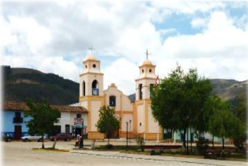
FIGURA 17: IGLESIA SAN JERÓNIMO – QUILCAS