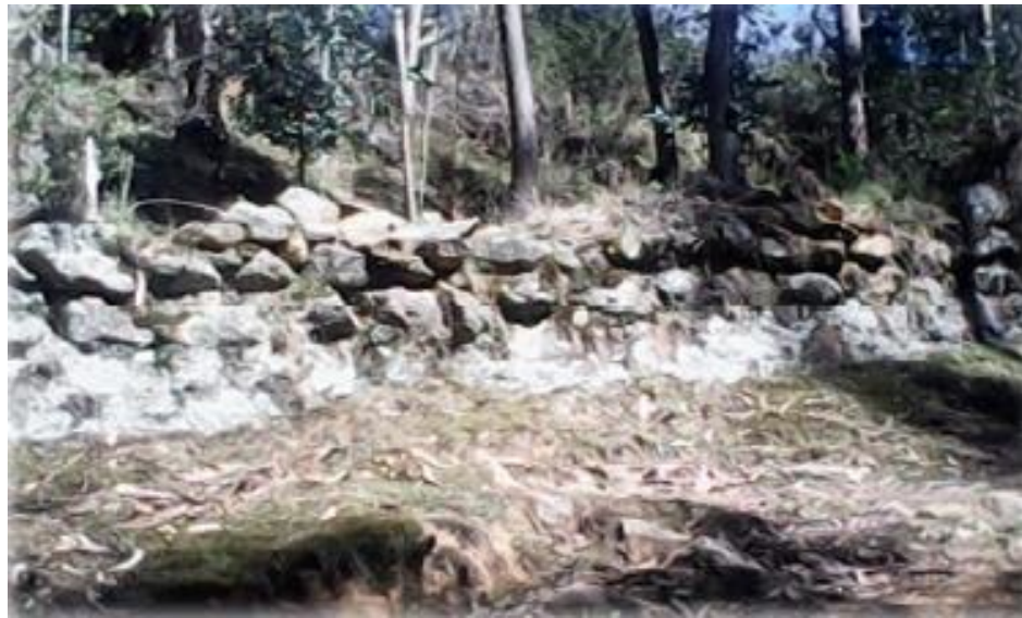
FIGURA 9: RESTOS ARQUEOLÓGICOS DE LA MURALLA DE COCAHUASI