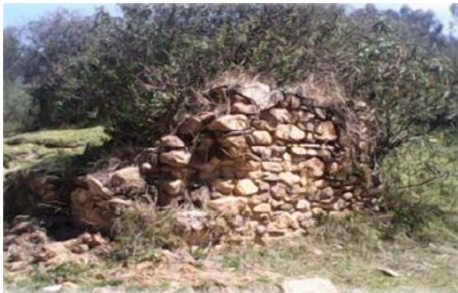
FIGURA 10: ESTADO ACTUAL DE LAS CONSTRUCCIONES EN COCAHUASI