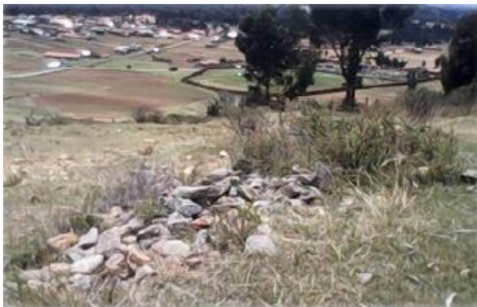
FIGURA 12: ESTADO ACTUAL DEL SITIO ARQUEOLÓGICO DE CHUWI