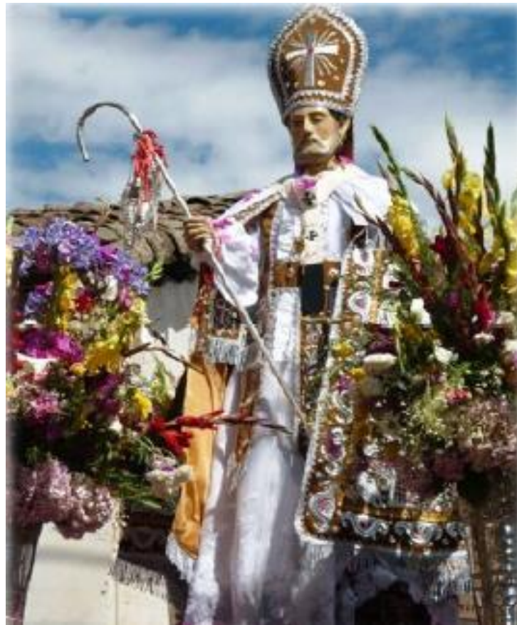
FIGURA 26 : PATRÓN SAN PEDRO, EN PROCESIÓN