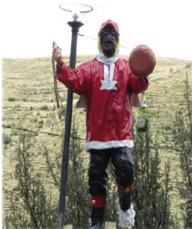
FIGURA 20: MONUMENTO A LA DANZA DEL CHAMORRO

Chamorro es una adaptación de los negritos de Huancavelica. Actualmente esta danza solo se baila en las fiestas de Quilcas (Rodríguez, 2003).