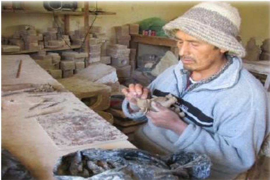
FIGURA 21: CERÁMICA EN PROCESO DE ELABORACIÓN

Quilcas el aspecto de cerámica está muy desolado ¡adiós a la cerámica en Quilcas.