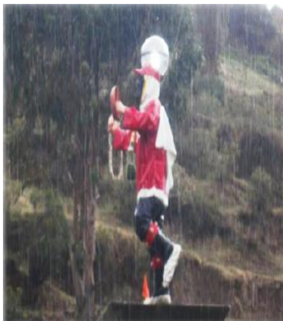
FIGURA 24: DANZANTE DE CHAMORRO