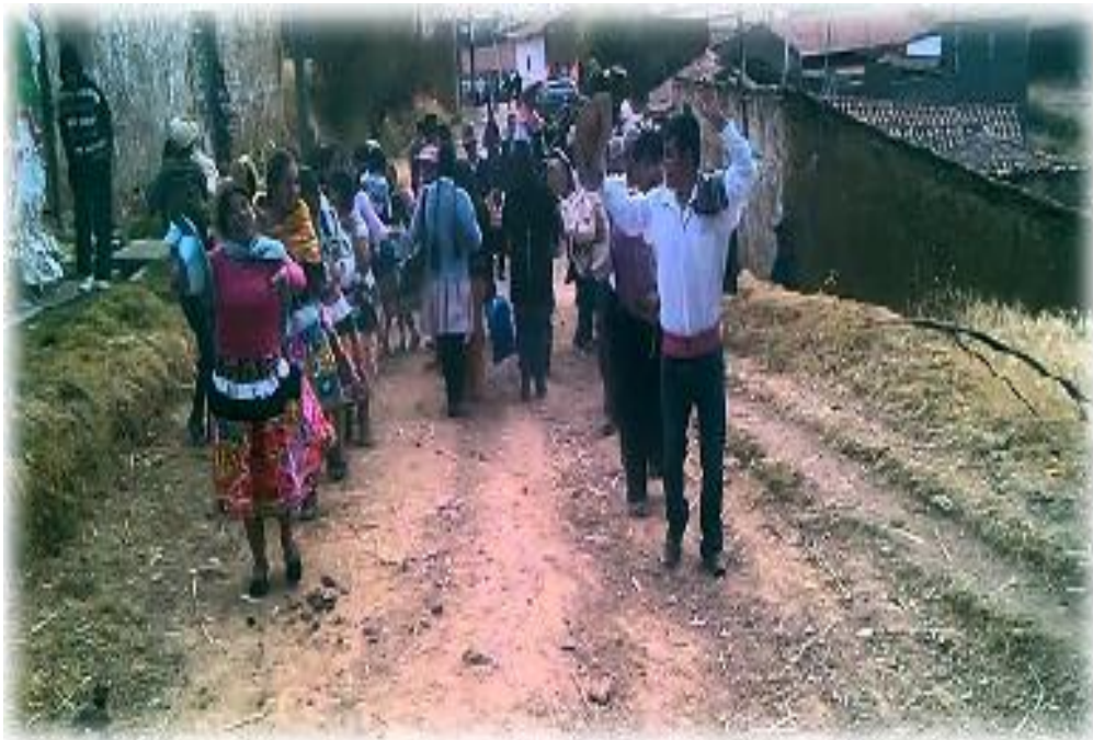
FIGURA 28 : POBLADORES DE QUILCAS BAILANDO SANTIAGO

Esta fiesta también se la conoce como “tinyacuy”, Quilcas lo celebra de una manera casi majestuosa, es celebrado cada 25 de julio, algo habitual en el valle del Mantaro. Es una fiesta ganadera-campesina, mejor dicho es la “fiesta del ganado”. En esta fiesta cobran mayor participación los pastores de todas las comunidades del distrito de Quilcas, donde la tinya, los “wuacras” o cornetas de cacho de toro, suenan para la fiesta de Santiago, consiste con la víspera donde velan a los animales con coca, cera, flores, esperando el “lucy, lucy” bebiendo el quemadito a base de huamanripa con caña pura, bailan alrededor de una fogata en el corral; el desayuno es mondongo y posteriormente señalan a los animales con cintas de colores colocados en la oreja, collar de flores y frutas, hay un padrino quien brinda cerveza, caña, reparte flores, coca, el que no mastica la coca son castigados dándoles a beber caña y cerveza, se da la “huallapada” (ofrenda) a los músicos, a los pastores también, después el baile popular (Dávila Pariona, Jonás – ganadero).